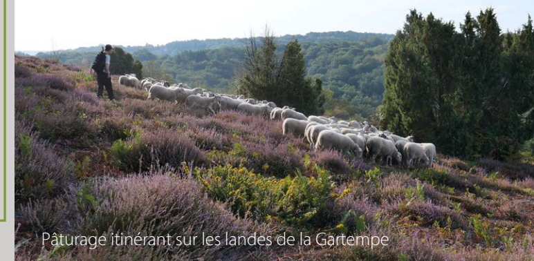
Pâturage itinérant sur les landes de la Gartempe