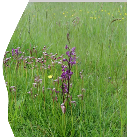
Prairie humide à Serapias lingua

Le réseau Natura 2000 est un ensemble de sites européens, désignés pour la rareté ou la fragilité des habitats naturels et des espèces animales et végétales qui s'y trouvent. Natura 2000 a pour vocation la conservation de ce patrimoine naturel en valorisant les usages locaux qui ont contribué au maintien de cette biodiversité.