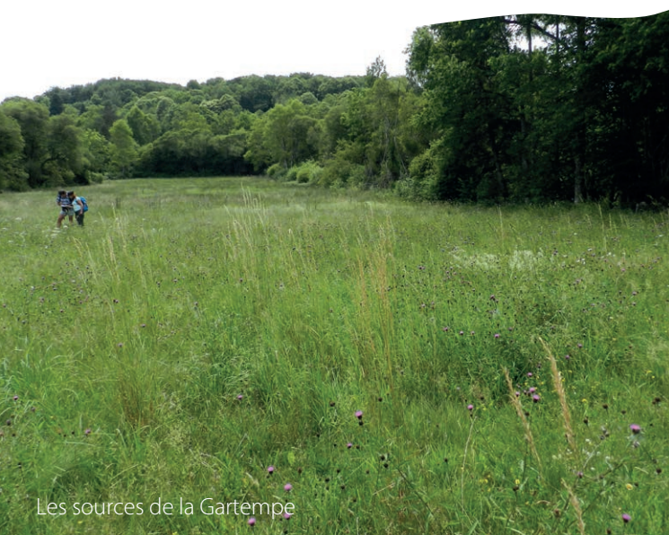
Les sources de la Gartempe

Ces milieux devenus rares à l'échelle européenne abritent une faune et flore remarquables, dont le Castor d'Europe, le Damier de la Succise, le Sonneur à ventre jaune, le Petit Rhinolophe ou la Mulette perlière.